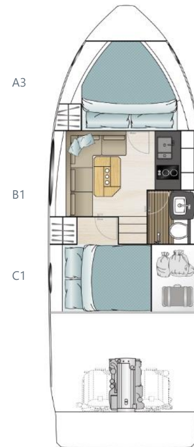
Нижняя палуба опциональная