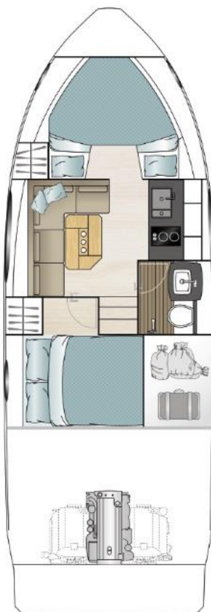
Нижняя палуба стандарт