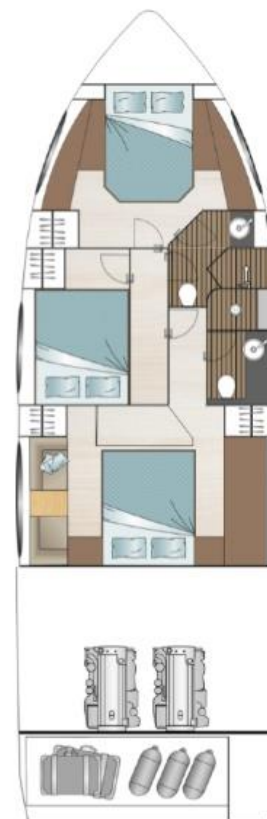
Нижняя палуба опциональная