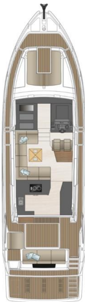
Главная палуба стандарт