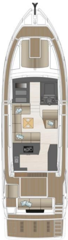
Главная палуба опциональная