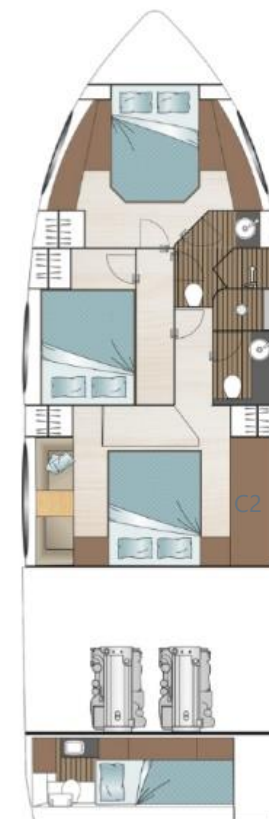
Нижняя палуба опциональная