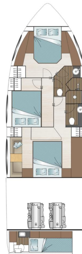
Нижняя палуба опциональная