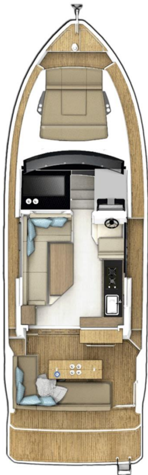
Главная палуба опциональная с фиксированным столом в кокпите и расширенной купальной платформой