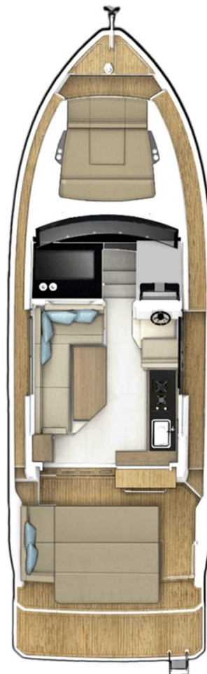
Главная палуба опциональная со столом в кокпите, трансформирующийся в лежак для загорания и расширенная купальная платформа