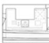
MAIN DECK OPTION