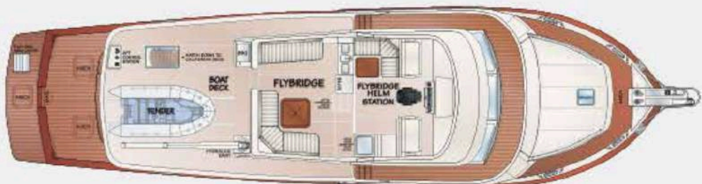
FLEMING 78 - FLYBRIDGE