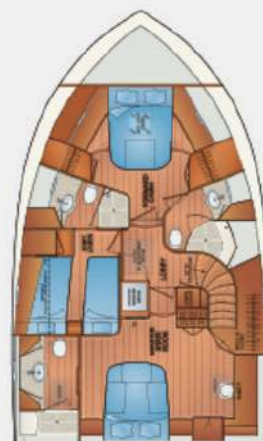
FLEMING 78 - OPTIONAL ACCOMMODATION (SHOWN with DIRECT ACCESS to MASTER CABIN from SALON)