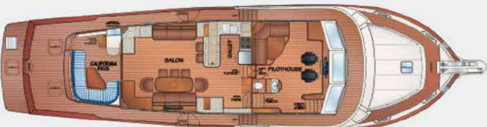
FLEMING 78 - MAIN DECK with DIRECT ACCESS to MASTER STATEROOM