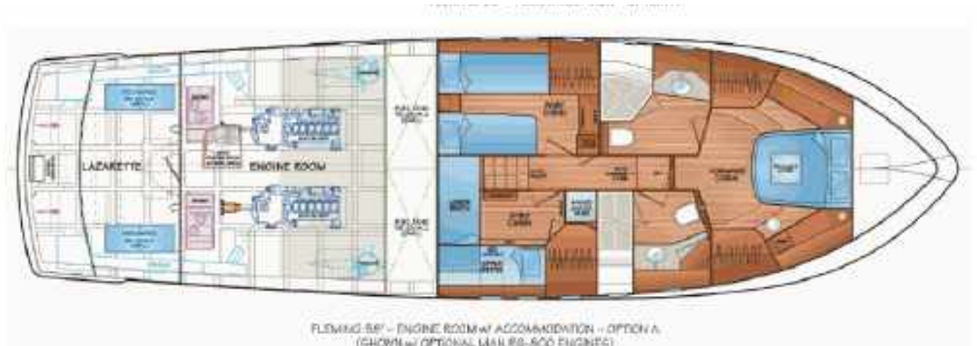
FLEMING 58 - ENGINE ROOM w/ ACCOMMODATION - OPTION A (SHOWN w/ OPTIONAL MAN 80-800 ENGINES)