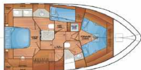
FLEMING 58 - ACCOMMODATION - OPTION C w/ BERTH & FORWARD CABIN