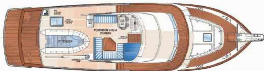
FLEMING 58 - FLYBRIDGE