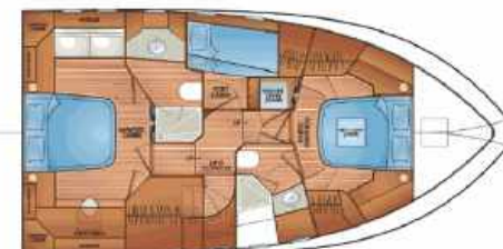
FLEMING 58 - ACCOMMODATION - OPTION B