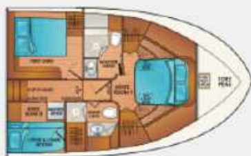
F55' – 3 STATEROOM 2 HEAD LAYOUT – with VIP PORT