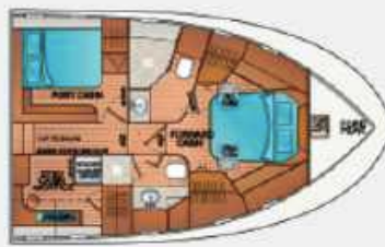
F55' – 3 STATEROOM 2 HEAD LAYOUT with VIP PORT and STARBOARD OFFICE