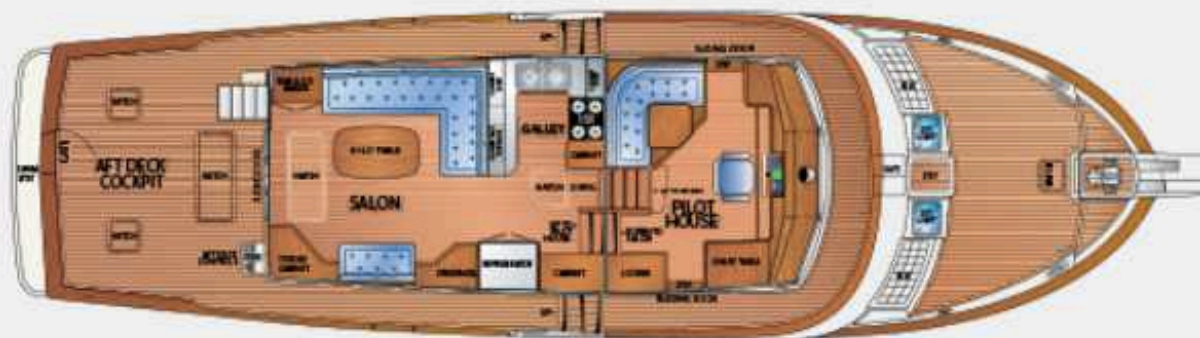
FLEMING 55' – MAIN DECK – SALON OPTION with STARBOARD SETTEE | PILOTHOUSE