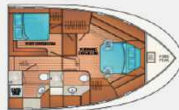
F55' – 2 STATEROOM 2 HEAD LAYOUT