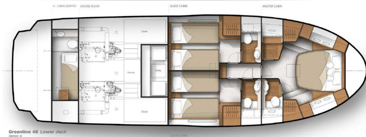
Greenline 48 Lower deck Option A