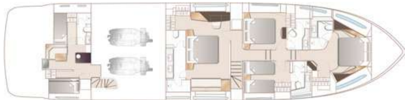
ОПЦИОНАЛЬНАЯ НИЖНЯЯ ПАЛУБА