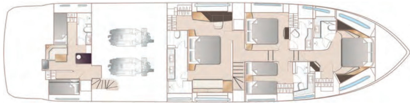
OPTIONAL LOWER DECK