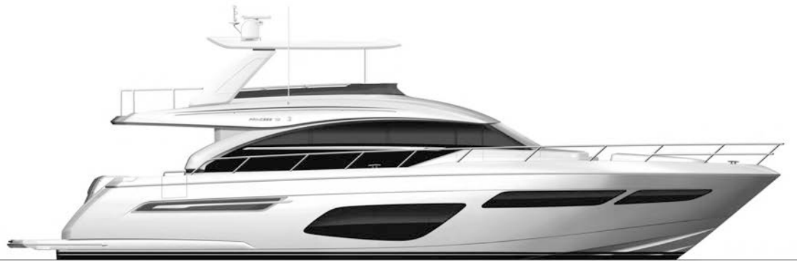
Белый корпус с хардтопом