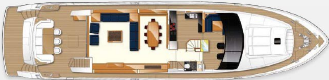
Upper accommodation layout