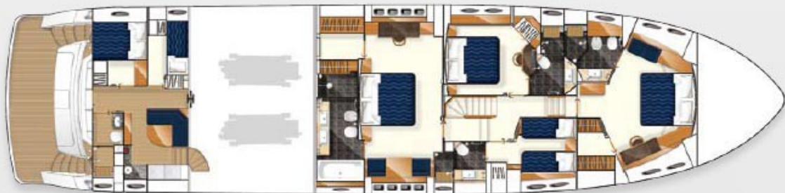
Lower accommodation layout